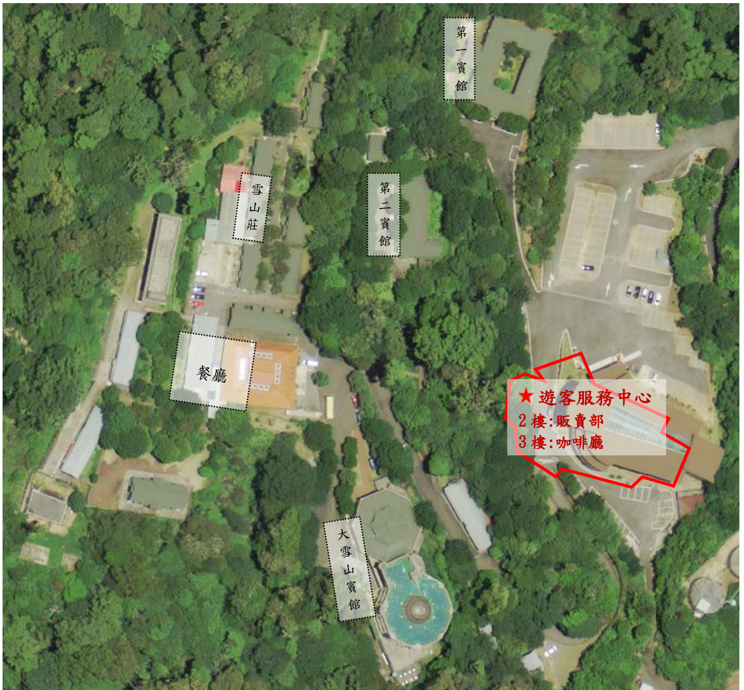
附件一、43k 遊客服務中心販賣部及咖啡廳位置圖